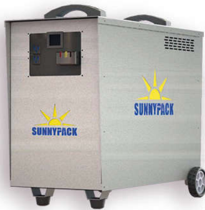
Para Baterías Litio Ion Inversor ILMP