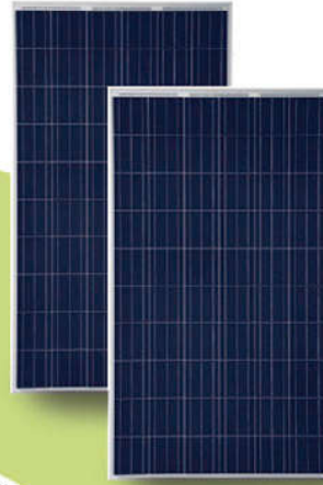
Paneles PERC HALF CELL (Opcional)